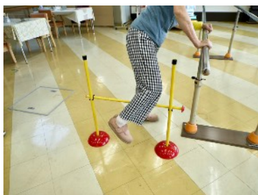
またぎ・入浴動作訓練