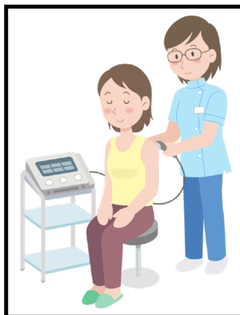
筋肉の固さや痛みを和らげる温熱療法

脳卒中のリスクとして高血圧・糖尿病・脂質異常症・不整脈・喫煙が挙げられますが、いずれも生活習慣の改善や薬で治療しコントロールできます。普段から適度な運動を取り入れた規則正しい生活をしましょう。